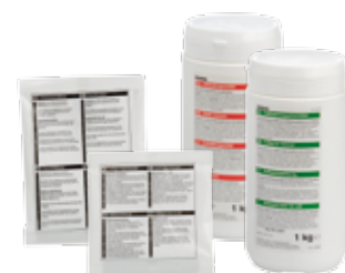
Entkalkungsmittel und Kaffeiansatzlösung